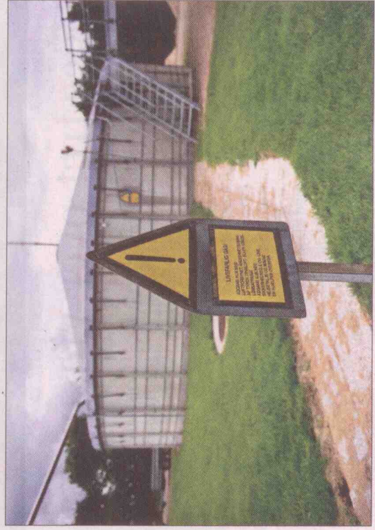
Den afgassede gylle lagres i tanke som den her, inden den køres ud til landmændene til udbrngning på markerne.